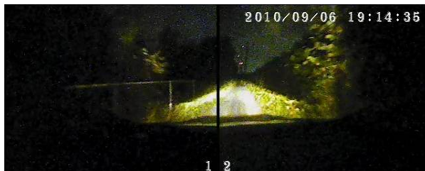
ヘッドランプの灯りだけでも撮影できます