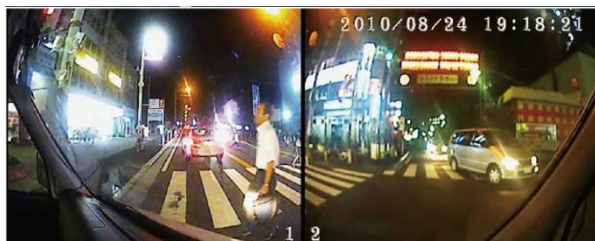
街中ではくっきり鮮明な映像

最低照度1.0ルクス。高感度センサーの採用で鮮明な夜間撮影が可能、しかも撮り漏れのない 常時記録タイプ。