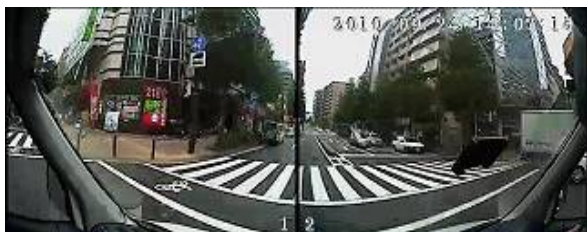
交差する道路も撮影

限りなく人間の視野に近い180°の撮影角度を確保するために、2個のカメラを内蔵しました。 真横からのトラブルに対しても確実に記録。※知的所有権 第254141号 取得