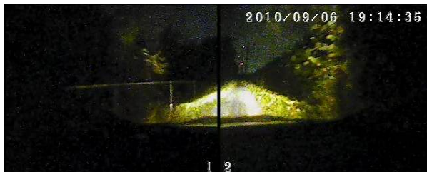
ヘッドランプの灯りだけでも撮影できます