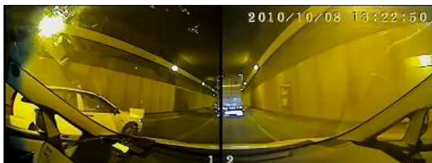
真横のクルマもこのように撮影